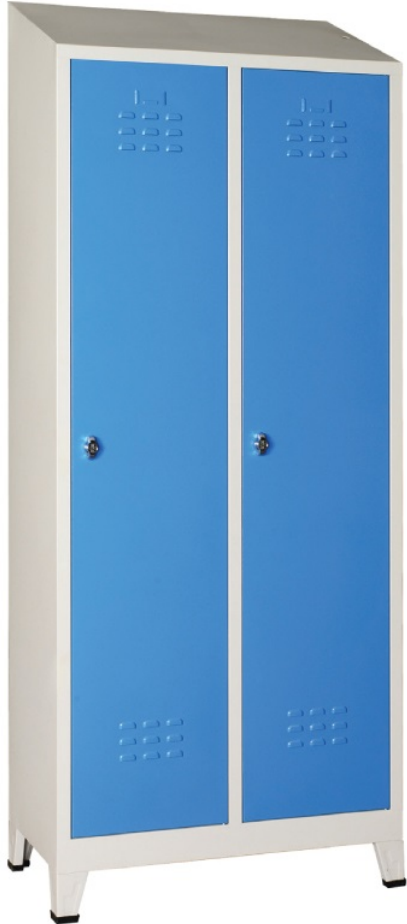
ÖM 2022 2'li Eğimli Soyunma Dolabı 185/195x80x40cm