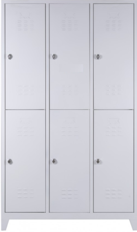
ÖM 2007 (Asma Kilit) 6'lı Soyunma Dolabı 200x117x40cm