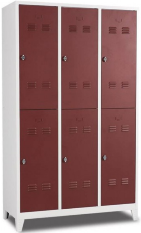
ÖM 2007 6'lı Soyunma Dolabı 200x117x40cm