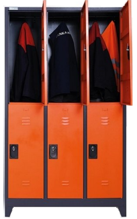
ÖM 2008 (Kare Kilit) 6'lı Soyunma Dolabı 200x117x40cm