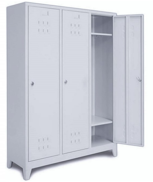
ÖM 2009 3'lü Soyunma Dolabı 185x117x40cm