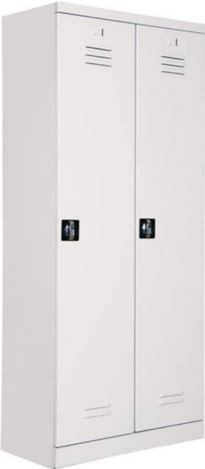
ÖM 2012 (Yeni Model, Kare Kilit) 2'li Soyunma Dolabı 185x80x40cm