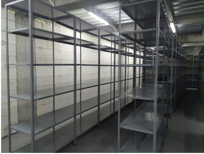
ÇİVATALI RAF SİSTEMİ