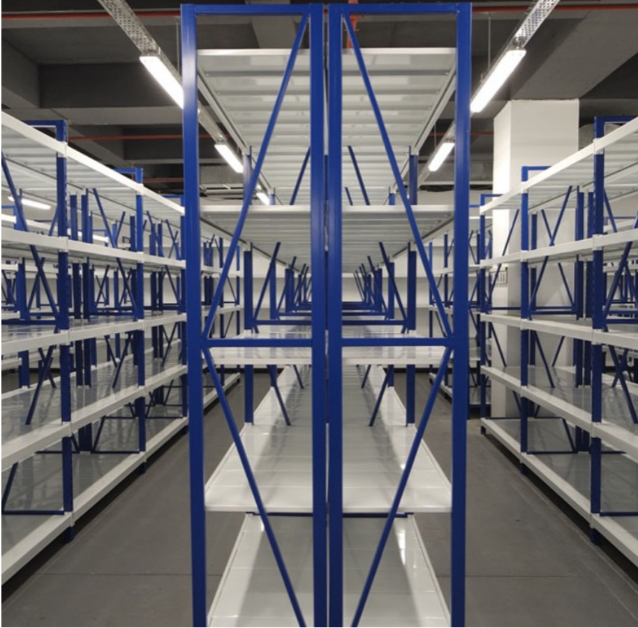
MİNİ YÜK RAF SİSTEMİ