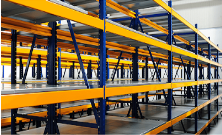
MINİ YÜK RAF SİSTEMİ