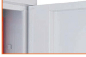
Yeni Tip Menteşe