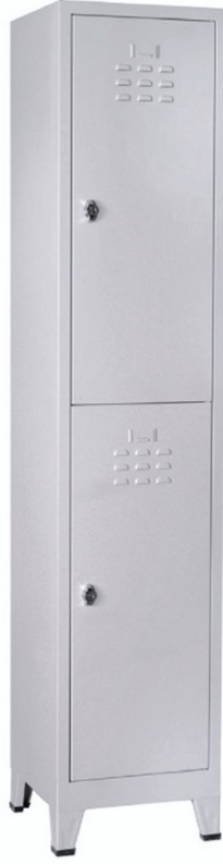
ÖM 2014 Yarım 2'li Soyunma Dolabı 200x40x41cm