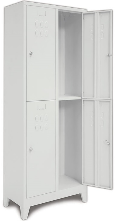
ÖM 2010 (Asma Kilit) 4'lü Soyunma Dolabı 200x80x40cm