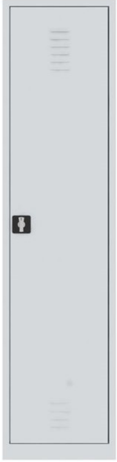
ÖM 2013 (Yeni Model, Kare Kilit) Tekli Soyunma Dolabı 185x40x41 cm