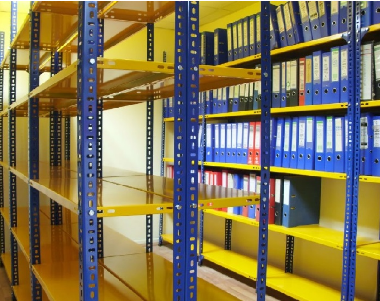
ÇİVATALI RAF SİSTEMİ