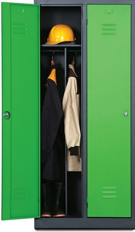
ÖM2020 (Yeni Model) 2'li Soyunma Dolabı 200x80x40 cm