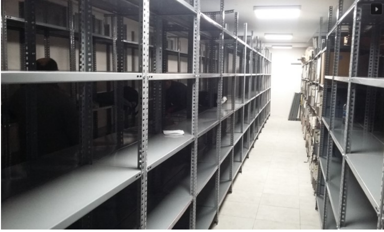
ÇİVATALI RAF SİSTEMİ