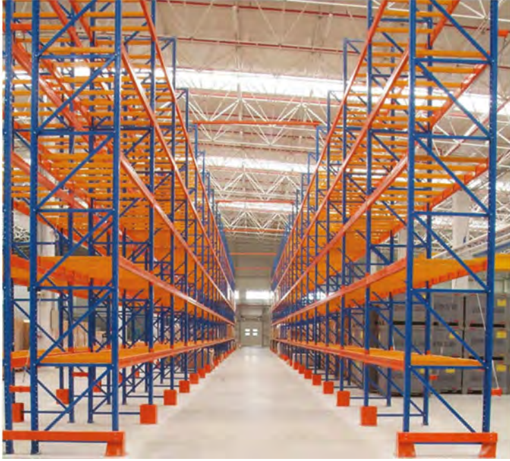
AĞIR YÜK RAF SİSTEMİ