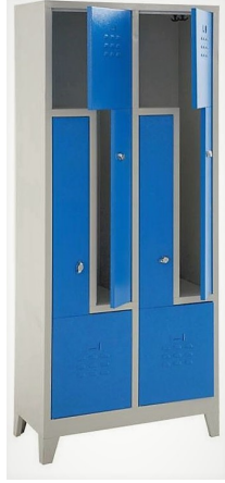
ÖM 2018 4'lü Z tipi Soyunma Dolabı 185x80x40 cm