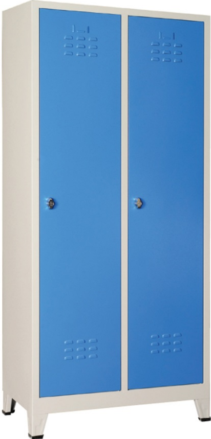
ÖM 2016 2'li Soyunma Dolabı 185x80x40cm