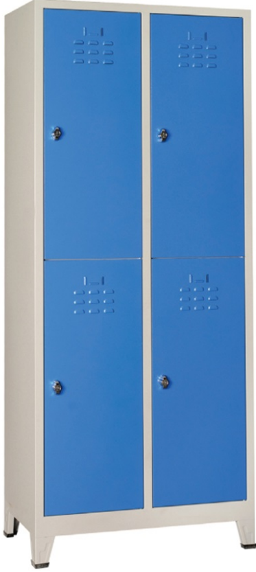
ÖM 2010 4'lü Soyunma Dolabı 200x80x40cm