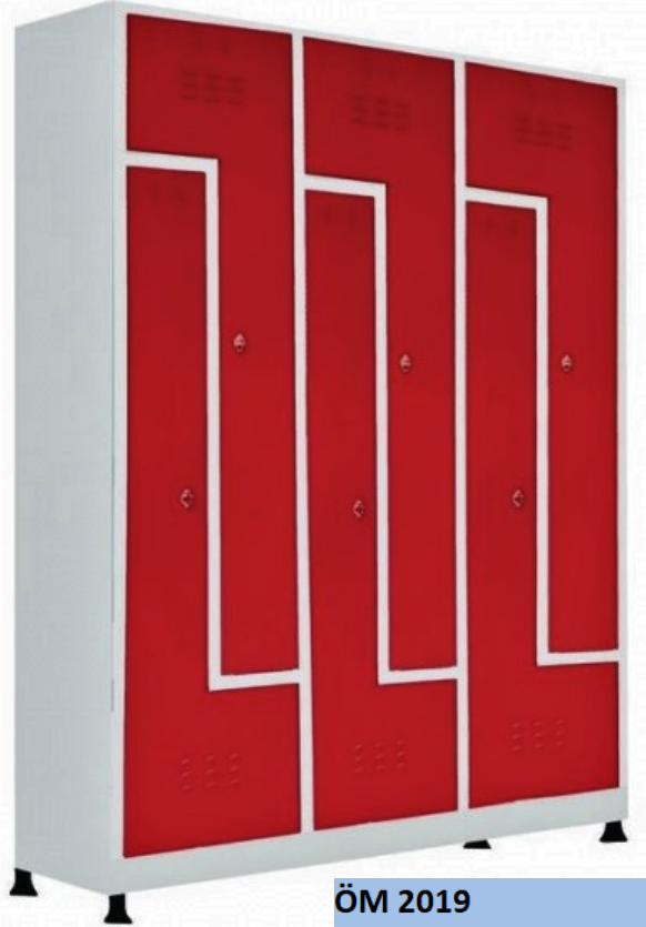
ÖM 2019 6'lı Z Tipi Soyunma Dolabı 185x117x40 cm