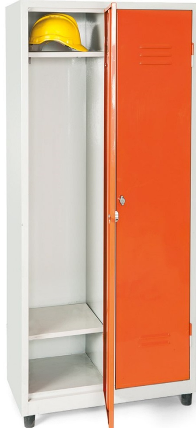
ÖM 2016 (Yeni Model) 2'li Soyunma Dolabı 185x80x40cm