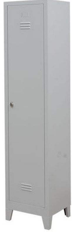
ÖM 2015 Tekli Soyunma Dolabı 200x41x40cm