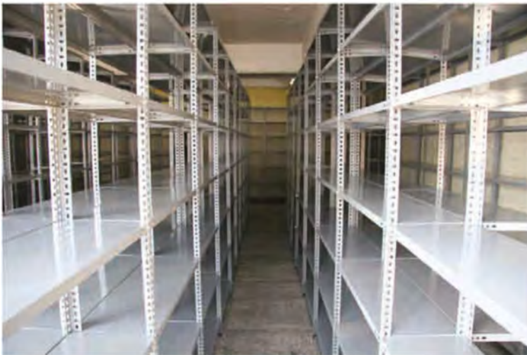
ÇİVATALI RAF SİSTEMİ