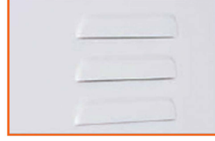
Standart Havalandırma 1