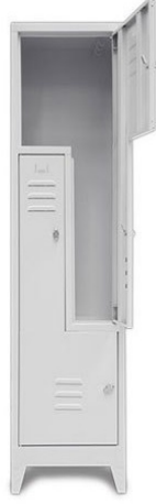
ÖM 2017 2'li Z Tipi Soyunma Dolabı 185x50x40 cm